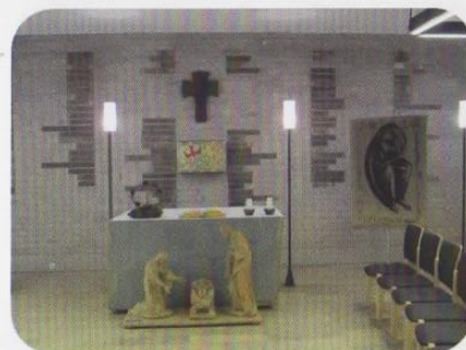
Heimkehrer-Dankes-Kirche Heilige Familie Karl-Friedrich-Str. 109 Bochum Weitmar-Mark

Auch für junge Menschen sind Kirche und Krypta in zweierlei Hinsicht lohnend. Zum einen erhalten sie Einblicke in die dunklen Jahre der Geschichte. Zum anderen vermittelt der Ort ein tieferes Verständnis für ein Leben in Frieden und Freiheit. Nachfolgende Generationen sollen erinnert werden: Das Recht auf Freiheit und Menschenwürde ist nicht selbstverständlich. Es muss stets ins Bewusstsein gerückt und bewahrt werden.